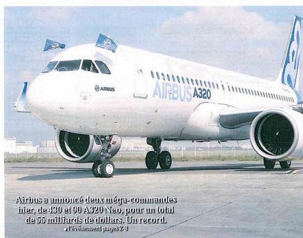
Airbus a annoncé deux méga-commandes hier, de 410 et 90 A320neo, pour un total de 50 milliards de dollars. Un record.

MURETAIN Pénurie de beurre : les JA sur le terrain