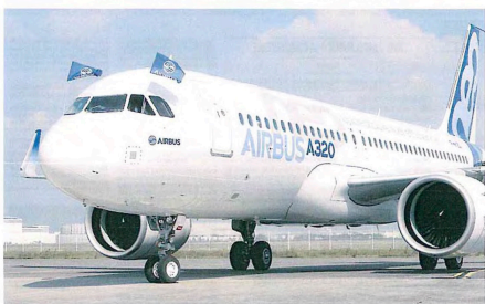
Airbus a annoncé deux méga-commandes hier, de 410 et 90 A320 Neo, pour un total de 50 milliards de dollars. Un record.

BLAGNAC Le collège Guillaume fête ses 50 ans page 24