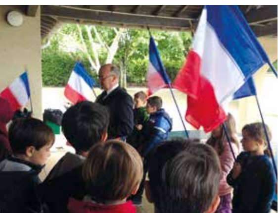
Commemoration de la journée « antiracisme » à l'école

Les enfants ont beaucoup de chance, car nous pouvons nous enorgueillir d'un corps d'enseignants et d'agents passionnés par leur mission éducative. Ils participeront à la mise en place du Conseil Municipal des enfants dès la rentrée scolaire prochaine.