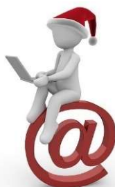
Meilleurs vœux pour 2017

Deux commerçants de l'ancien marché ont souhaité revenir proposer leurs produits. C'est avec plaisir que nous retrouverons les jeudis à 17h (à partir du 12/01) : le crêpier et le réunionnais (La Case bourbon) sur le parking du terrain de foot.